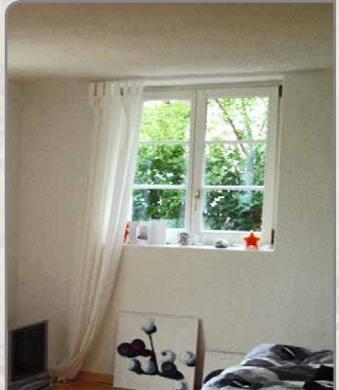
Sanierung von Hydroment im Jahr 1994. Fotografiert 2013

Durchfeuchtete und hochgradig salzbelastete Aussenwände. Der Putz brüchig und mürbe, abblätternde Farbanstriche, aufgrund der hohen Feuchtigkeit im Mauerwerk.