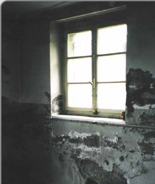
Raum im Untergeschoss eines Hauses in Hanglage