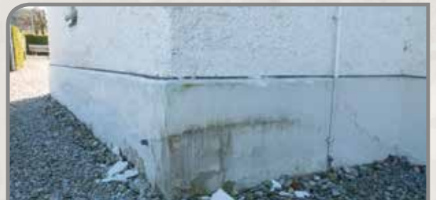
Wiederkehrende Putzschäden im Sockelbereich trotz mehrmaliger Sanierung