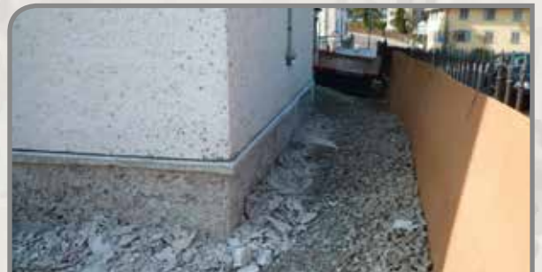
Abspitzen des Putzes bis zur Grundmauer