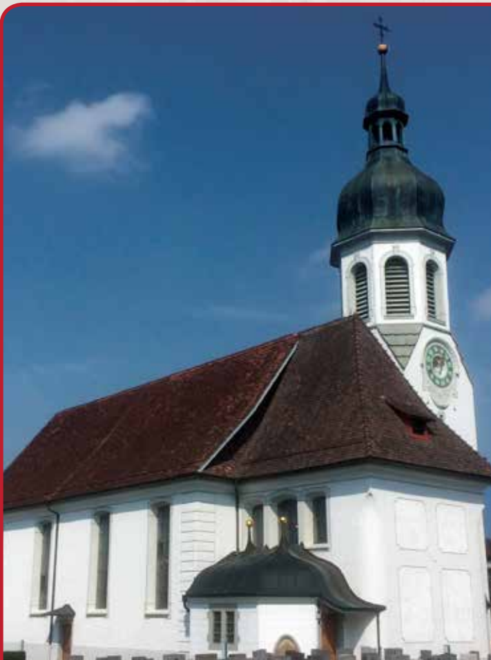
Kath. Kirche Jonen