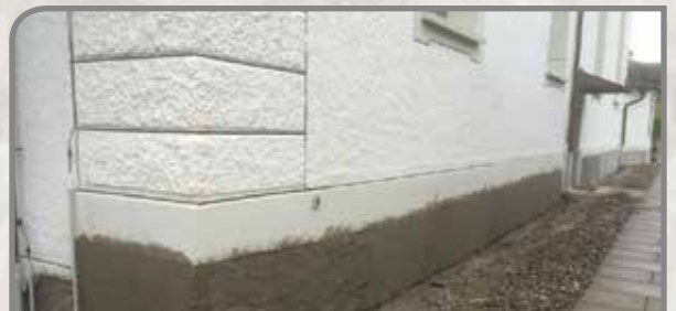
Schichtweises Auftragen der Putzlagen. Abschluss mit mineralischem Abrieb