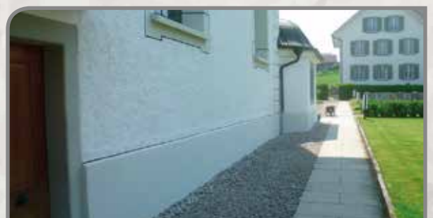
Schlussanstrich mit Mineralfarbe