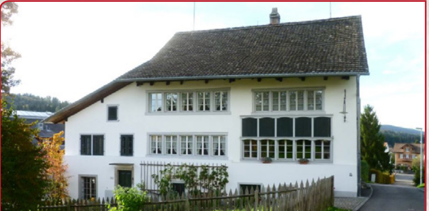
Ortsmuseum / Helen Dahm Museum Oetwil am See