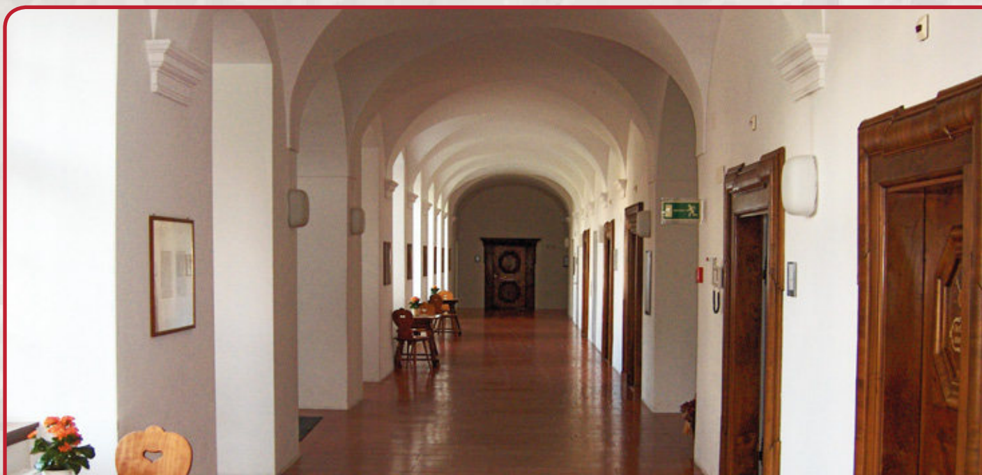
Reha-Klinik St. Katharinental