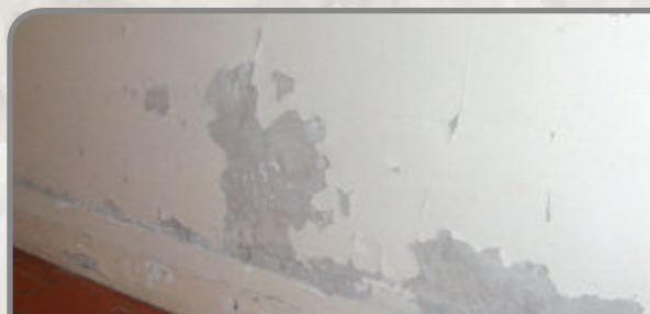
Farb- und Putzabblätterung in Folge von Salzausblühungen